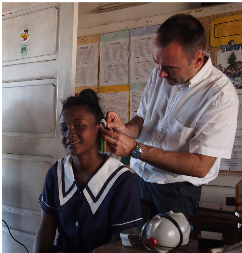
Une à deux fois par an, une équipe d'Acoustique Wernert prend la direction de l'île de Madagascar, où elle mène une action humanitaire en faveur d'enfants malentendants.